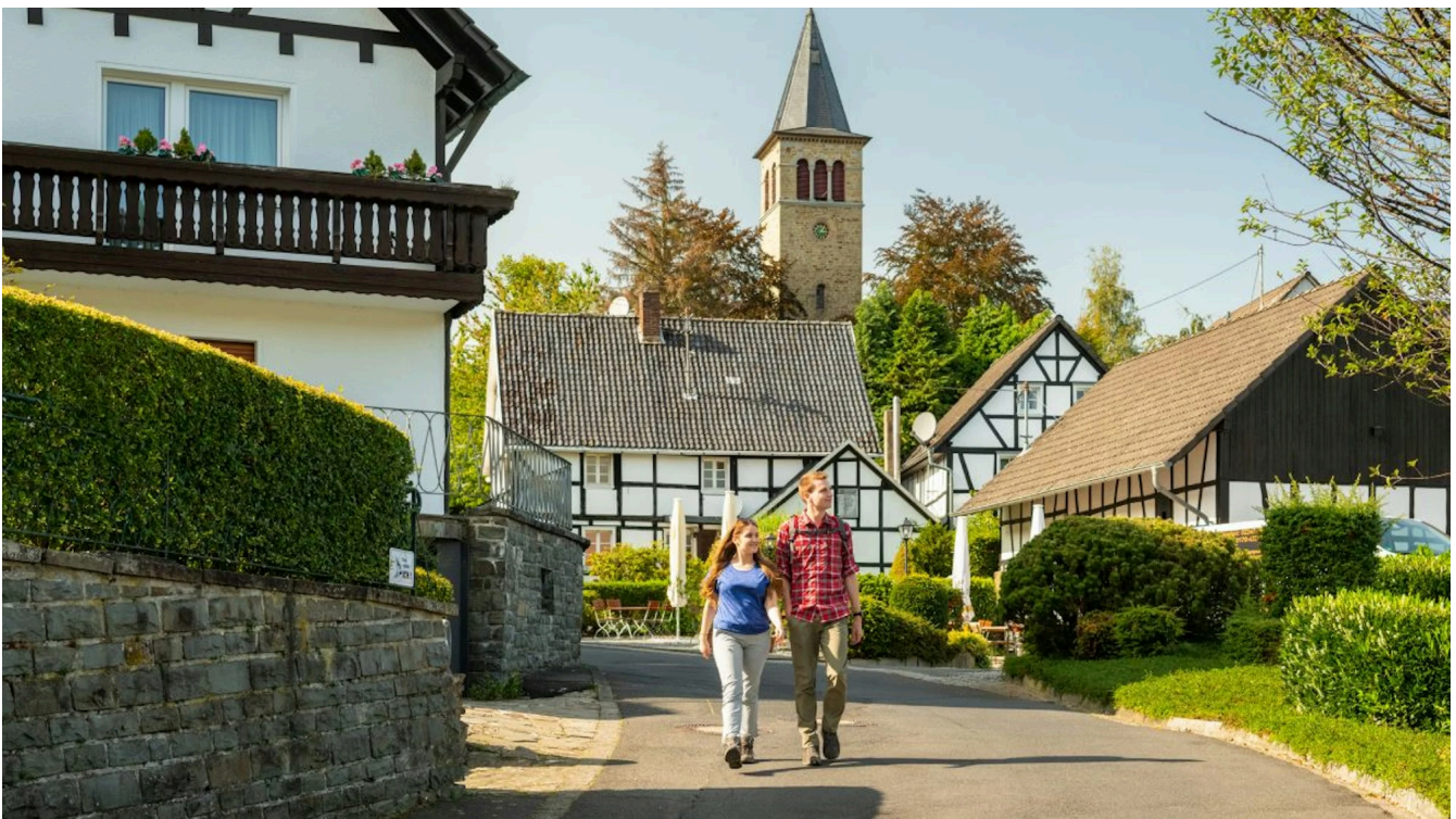
Beginn der Bergischen Wanderwochen ist am 25. April.

Köln Region Freizeit Sport FC Panorama Politik Wirtschaft Kultur Rätsel Newsletter E-Paper