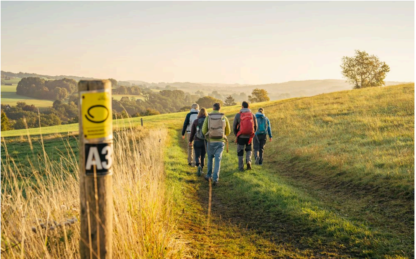
Im Programm gibt es mehrere Touren.